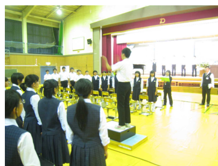
黒耀祭で合唱する和田中の生徒と南部中2年生(手前)