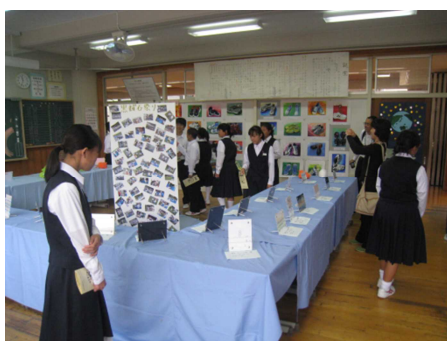
紫苑祭の教室展示を見学する和田中の1、2年生