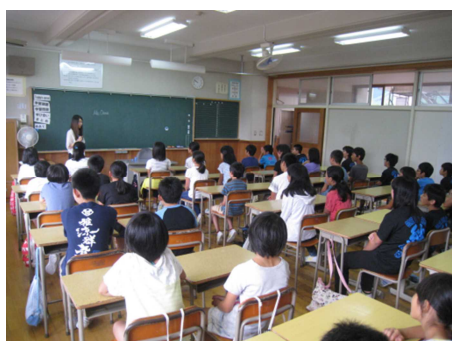
南部中で一緒に英語の授業体験をする武石小、長門小、和田小の6年生

9月8日(木)は、来年度南部中に入学する武石小、長門小、和田小の3校の6年生が南部中に集まり交流をした後、合同で英語の授業体験をしました。また23日(金)は和田中1・2年生が紫苑祭を見学。開祭式では南部中生、和田中生と3校の小学6年生で「コスモス」を合唱しました。さらに30日(金)は黒耀祭に南部中2年生が訪問。和田中生の総合的な学習のステージ発表を見学した後、「明日の空へ」を合唱し交流をしました。